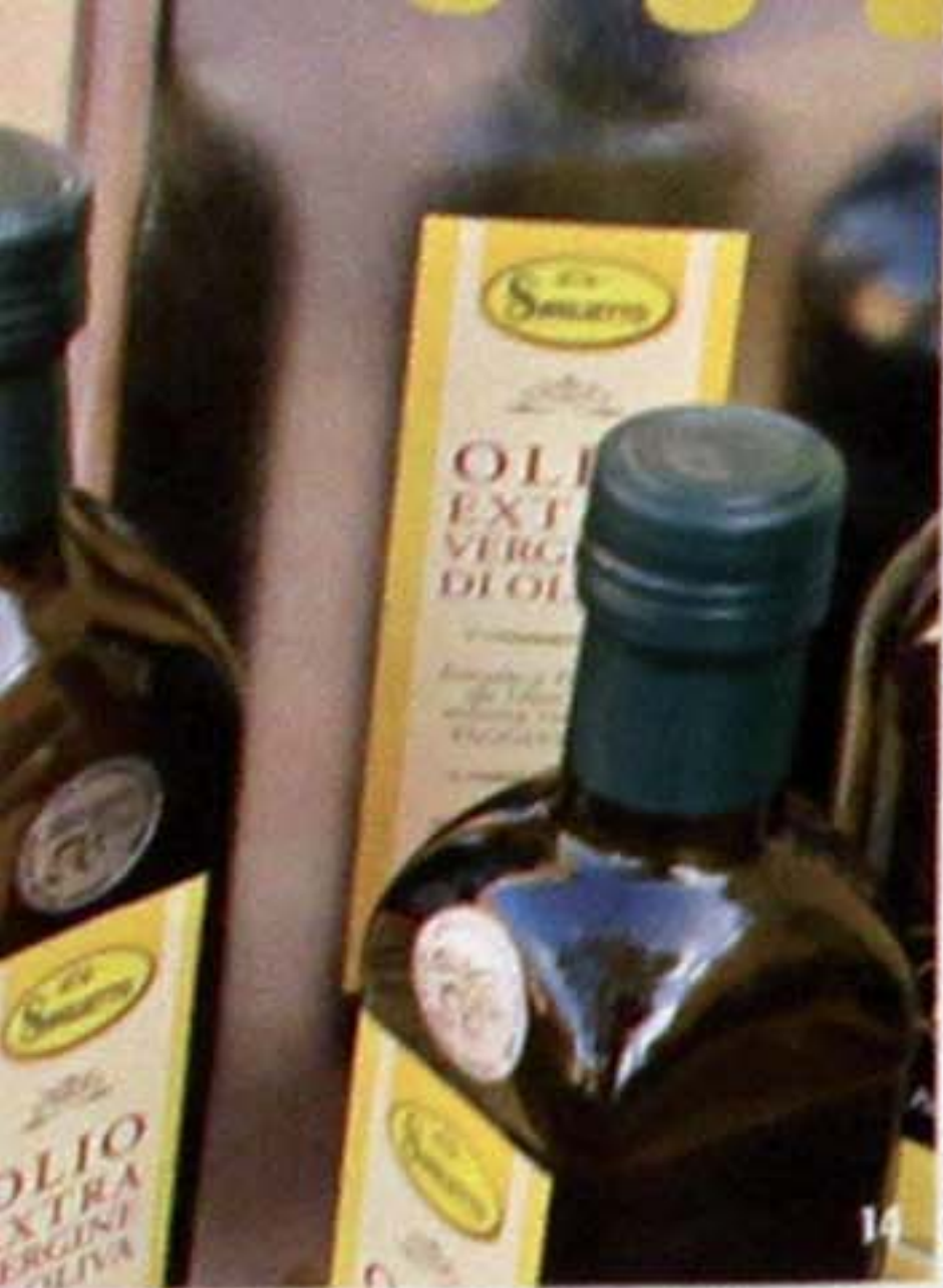
14. Bottiglie di olio prodotte dalla tenuta Saglietto a Poggi. 15. Delizie dolci e agrodolci in vendita da Gelleano a Diana Marina. 16. Il pino centenario simbolo della Tenuta Saglietto che ospita anche un agriturismo che fa parte dell'associazione Mete di Liguria.